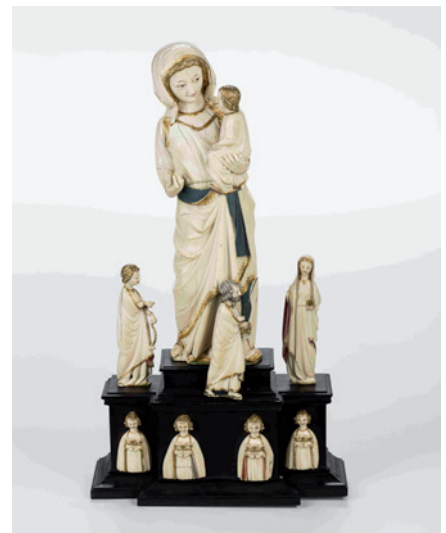
Abb. 2, oben: Stift Zwettl, Paramentenkammer.