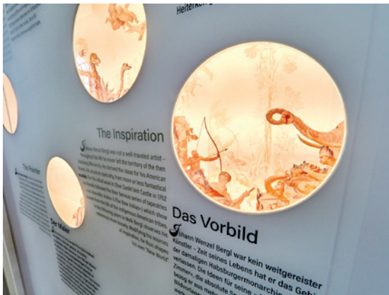
Abb. 6: Andreas Gamerith/ no_mad designers, Informationstafel zu Johann Wenzel Bergl, Stift Melk, Gartenpavillon (Foto: Benediktinerstift Melk/schewig fotodesign).

Hier gilt vor allem eine Regel: Kürzen! Keine Informationen, die in ihrer Bedeutung für den Gast nicht unmittelbar ersichtlich sind (beispielsweise zu exakte Jahreszahlen), sollten in Raumtexten vorkommen. Besonders wichtig ist die Grundhaltung, dass eine Ausstellung/Präsentation kein "Buch" darstellt. Wenn Sie einen Sachverhalt nicht kürzen können, müssen Sie sich die Frage stellen, ob Sie vielleicht selbst Relevantes von Irrelevantem nicht unterscheiden können. Es ist besser, den Gästen Impulse zum Nachdenken zu schenken, als sie mit einem Wust von scheinbar vollständiger Information abzustößen.