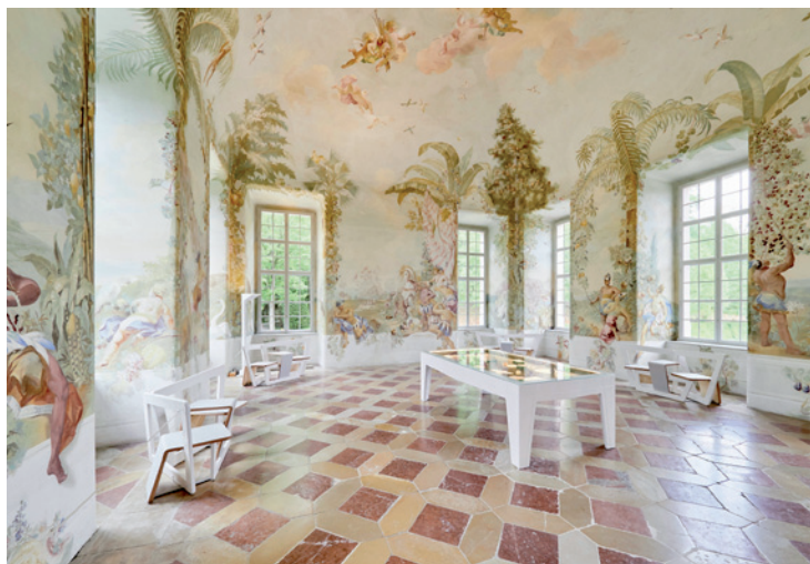
Abb. 7: Johann Wenzel Bergl, „Amerikanisches Zimmer“, 1763/64, Stift Melk, Gartenpavillon.

Es mag als Ratschlag seltsam erscheinen, doch ist es unmöglich, eine überzeugende Präsentation zu etablieren, wenn man den Gästen keine Liebe entgegenbringt. In welcher Form Sie auch immer „vermittelnd“ agieren, Sie können gewiss sein, dass