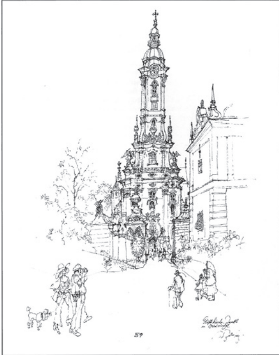
Abb. 1: Wilfried Zeller-Zellenberg, Stiftskirche Zwettl im Waldviertel, 1977 (Abb. aus: Wilfried Zeller-Zellenberg, Mein Österreich-Bilder-Buch. Amalthea-Verlag, 1977).