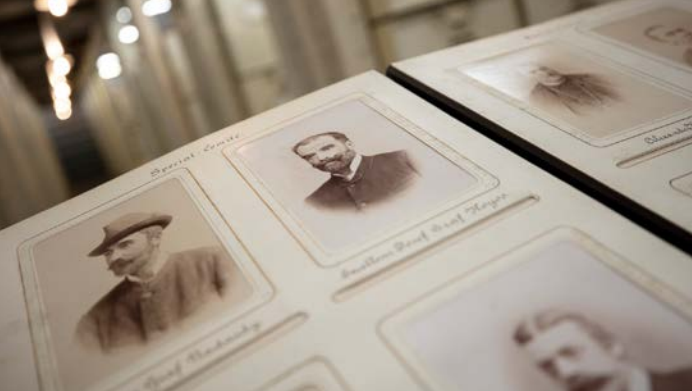
Fotoalbum aus dem Herrschaftsarchiv Walpersdorf in Niederösterreich