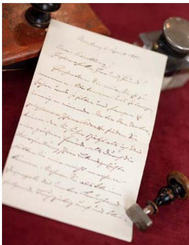
Brief aus dem Nachlass Schlitter