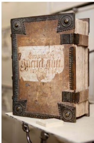
Kopialbuch der Familie Eyczinger aus dem Herrschaftsarchiv Grafenegg

Ziel ist der Erhalt historisch und kulturell bedeutender Dokumente in Österreich.