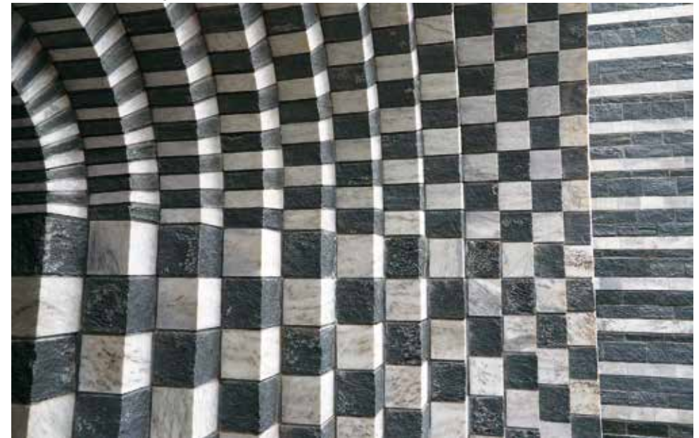
Die vielen Steine und das größere Ganze