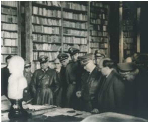
Adolf Hitler bei einer Besichtigung der Stiftsbibliothek St. Florian, ein Bild für die Präsenz und Einflussnahme des NS-Regimes auch im kirchlichen Raum.

Die Veranstaltung setzte einen nachhaltigen Impuls für Forschung, Vermittlung und Erinnerungskultur im Bereich kirchlicher Archive. Sie wurde vom Bereich Kultur und Dokumentation der Österreichischen Ordenskonferenz (ARGE der Ordensarchive Österreichs) in Kooperation mit dem „Franz und Franziska Jägerstätter Institut“ (Katholische Privat-Universität Linz) von 5.–7. Mai 2025 in Linz durchgeführt. Die Vorträge sind in den „Mitteilungen zu den Kulturgütern der Orden 2025“ publiziert.