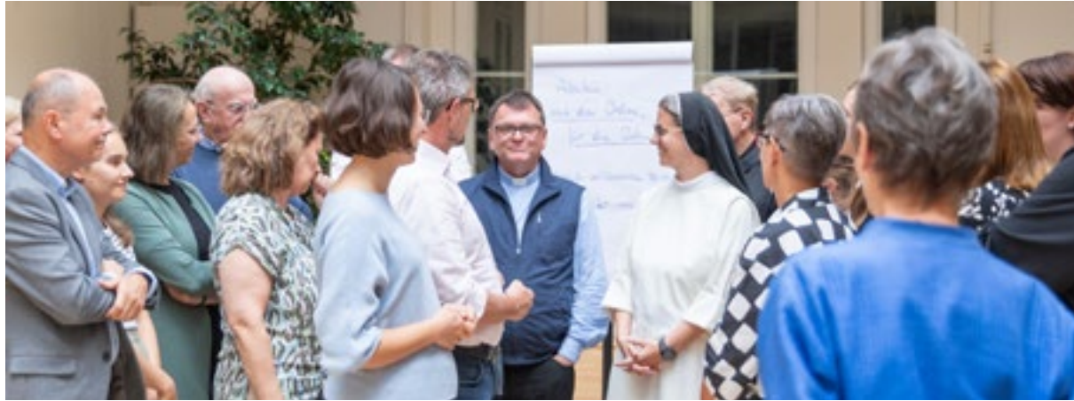
15. September 2025: Mitarbeiter:innen-Tag der Österreichischen Ordenskonferenz zum Thema „Arbeiten mit den Orden für die Orden.“

16. Mai 2025: „ausserordentlich“-Sommerfest zum Thema „Grenzen überwinden“ Innenhof der Jesuiten, Wien