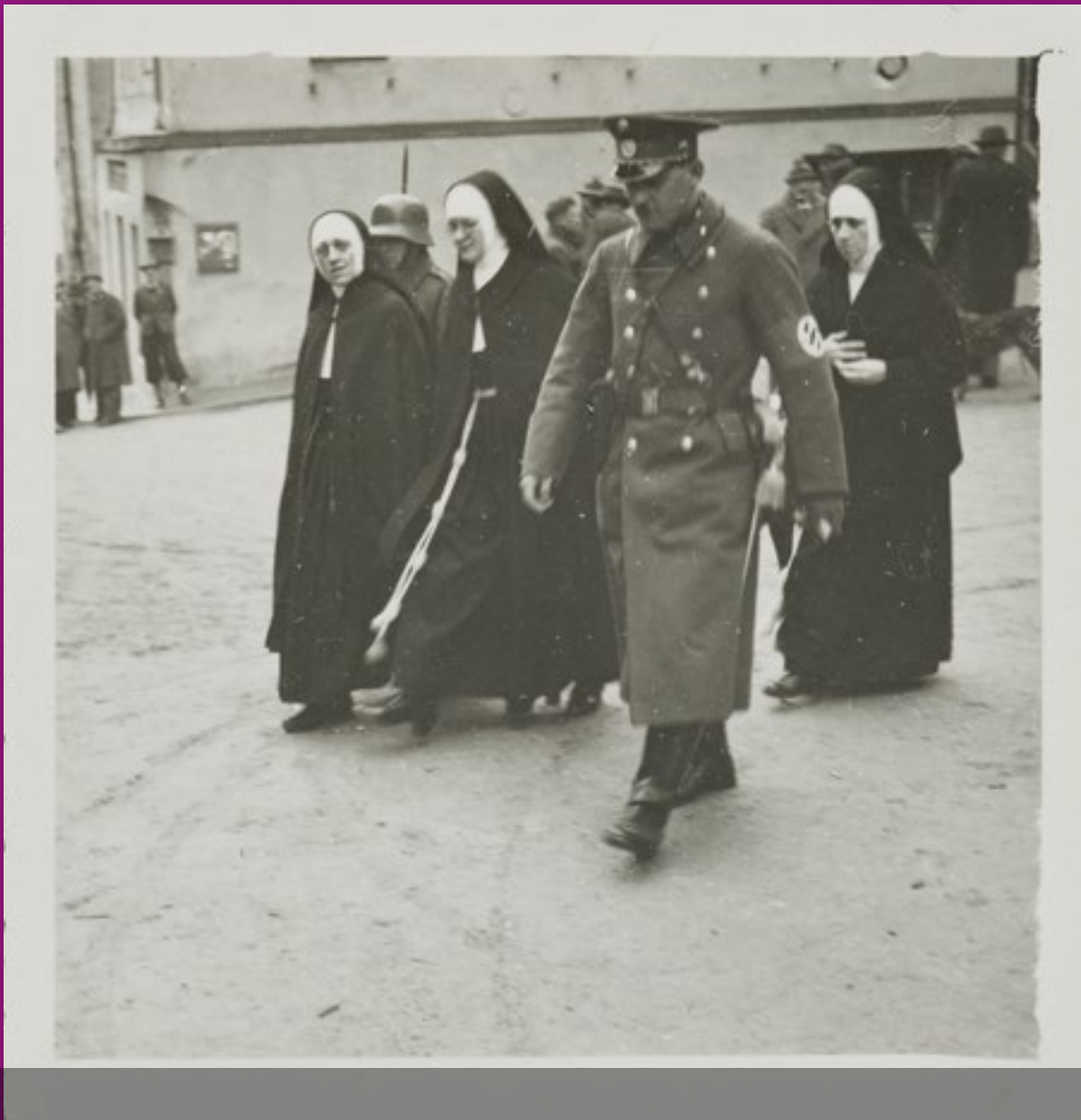
Halleiner Schulschwestern wurden während der NS-Zeit von einem Gestapooffizier abgeführt, ein Beispiel für Verfolgung und Repression gegenüber Ordensgemeinschaften.