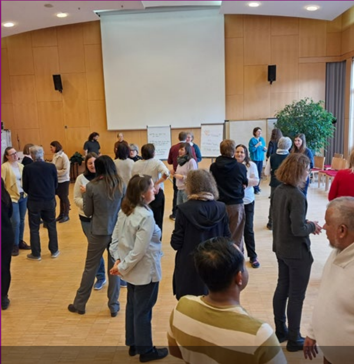
Im Frühjahr 2025 lag der Schwerpunkt des Mitarbeiter:innentags im Kardinal König Haus auf dem Geben und Nehmen von Feedback.