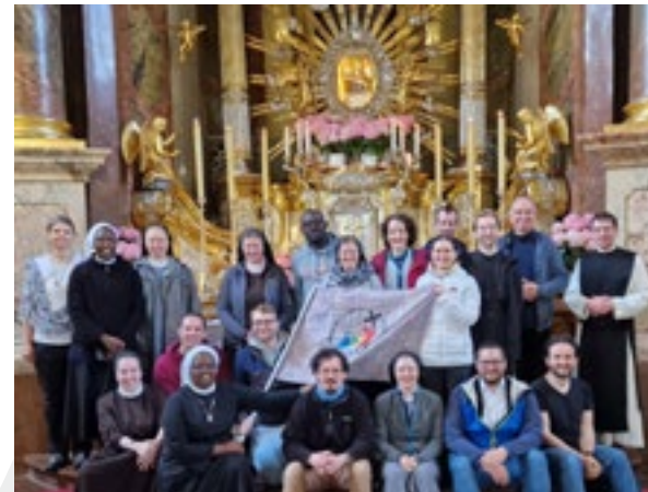
Am 17. Mai 2025 pilgerten junge Ordensfrauen und -männer im Zeichen der Hoffnung von Melk nach Maria Taferl.