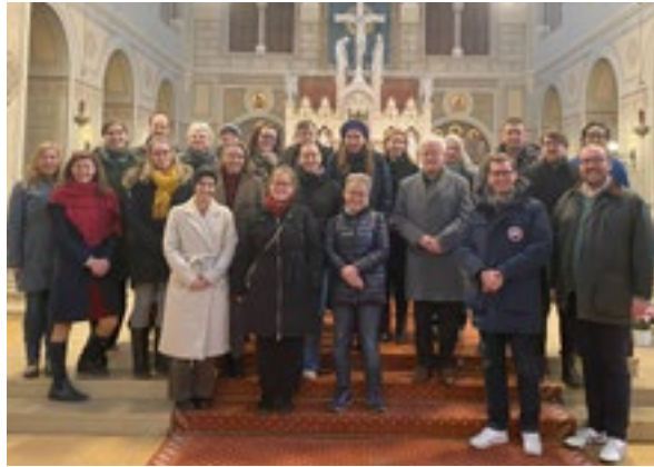
Rund 25 Teilnehmer:innen trafen sich am 27. Februar 2025 zum Praxistag Inventarisierung.

27. Februar 2025: Praxistag Inventarisierung Karmelitenkonvent Wien