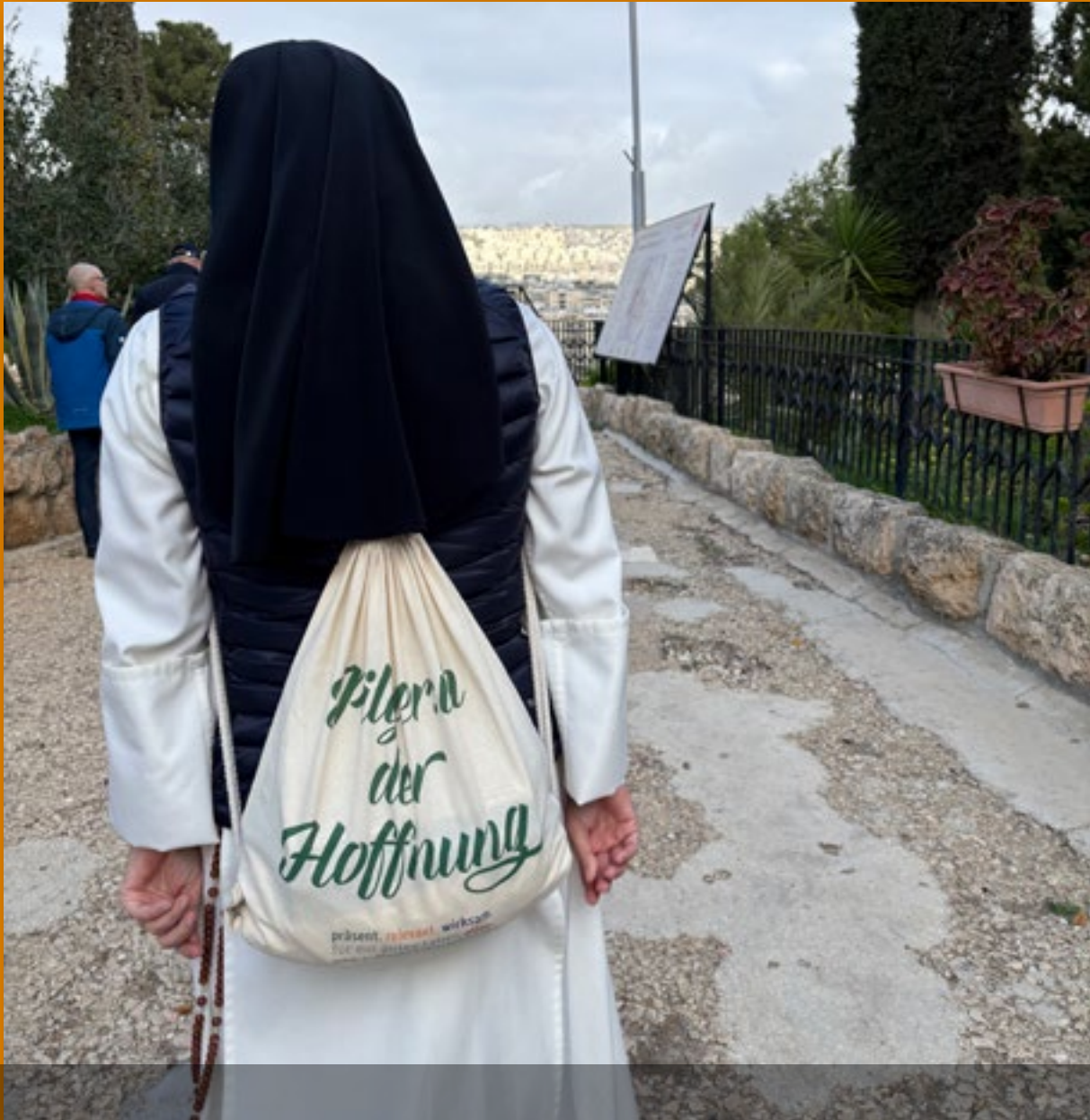
Ordensleute sind Pilgerinnen und Pilger der Hoffnung.