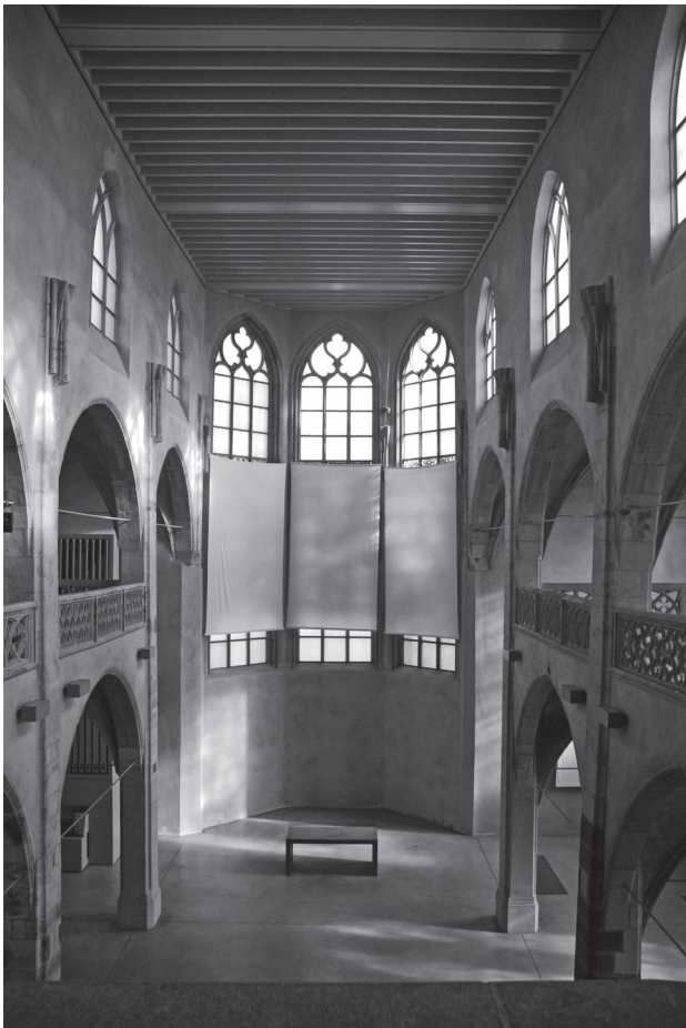
Abb. 5: Blick in den Innenraum der Kunststation St. Peter in Köln

Kirchliche Goldschmiedekunst ist ein komplexes Handwerk. Sie vereint Schmuck-, Silber- und Metallarbeit und reicht bis in konstruktive Aufgaben hinein. Ursprünglich stammt dieser Beruf aus den Klöstern selbst. Ihn weiterzuführen, war für die Gemeinschaft von Gut Aich nicht nostalgisch, sondern folgerichtig. Heute arbeiten in der Goldschmiede dort Meister und Lehrlinge gemeinsam. In der jungen Generation spüren wir eine große Sehnsucht, das Alte nicht