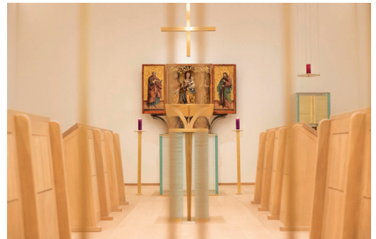
Abb. 6–8: Einblick in die Chorkapelle des Benediktinerstifts Admont

Wie ereignet sich Gott im Leben? Wie wird etwas einsichtig und bleibt doch verborgen, unbegreiflich – ein Geheimnis?