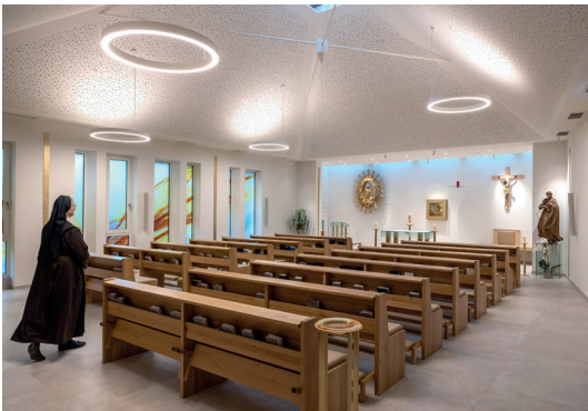
Abb. 9–13: Kapelle der Marienschwestern vom Karmel in Bad Mühlacken

Die Gemeinschaft entschied sich, nach Bad Mühlacken zu übersiedeln, an einen Ort, der ihnen vertraut war. Dort betrieben sie bereits ein Kurhaus, eingebettet in die Landschaft des Pesenbachtals im oberösterreichischen Mühlviertel. Die Bitte an uns war ebenso klar wie herausfordernd: Aus dem großen Speisesaal dieses Kurhauses, der in den 1980er-Jahren gestaltet worden war, sollte eine Kirche entstehen und die vorhandene Struktur bleiben. Die Frage war: Was